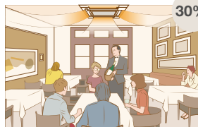
Pomieszczenie zajmowane częściowo