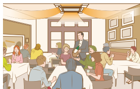
Pomieszczenia zajmowane w pełni